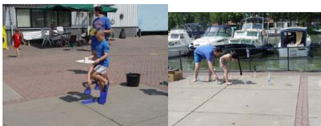
Flipper race en olifantenmars